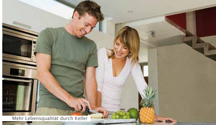
Mehr Lebensqualität durch Keller

Weitere Informationen erhalten Sie außerdem unter www.prokeller.de