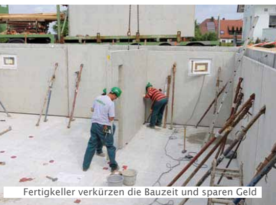
Fertigkeller verkürzen die Bauzeit und sparen Geld