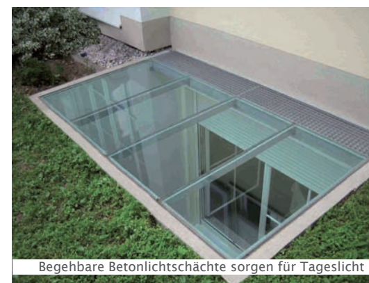
Begehbare Betonlichtschächte sorgen für Tageslicht