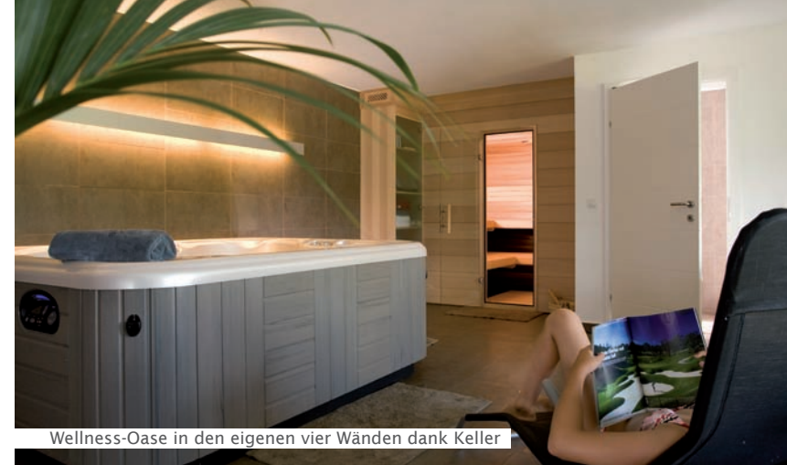
Wellness-Oase in den eigenen vier Wänden dank Keller

Den attraktiven Nutzungsmöglichkeiten eines Kellers sind kaum Grenzen gesetzt. So können z.B. Keller bei Bedarf auch als Souterrain-Wohnung mit Gartenzugang ausgebaut werden.