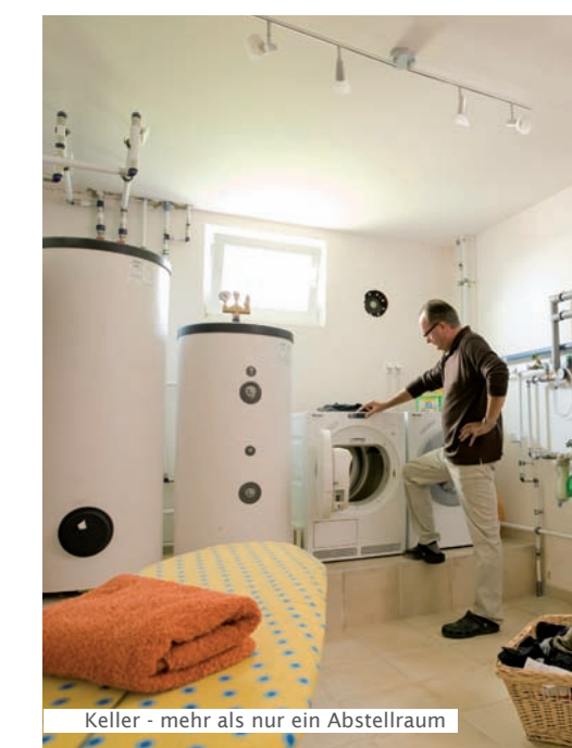
Keller - mehr als nur ein Abstellraum

Gerade bei Reihen- und Doppelhäusern ist ein Keller unverzichtbar. Denn selbst bei Haustrennwänden mit getrennten Fundamenten ist der Schallschutz bei nicht unterkellerten Eigenheimen oft nicht ausreichend. Messungen haben ergeben, dass dieser in den oberen Etagen etwa 3-5 dB schlechter ist als bei einem Haus mit Keller. Das bedeutet konkret mehr als eine Halbierung des Schallschutzes. Der Ärger mit dem Nachbar ist somit vorprogrammiert und eine nachträgliche Verbesserung kaum oder nur mit Verlust an Wohnfläche möglich. Ein Keller beugt vor.