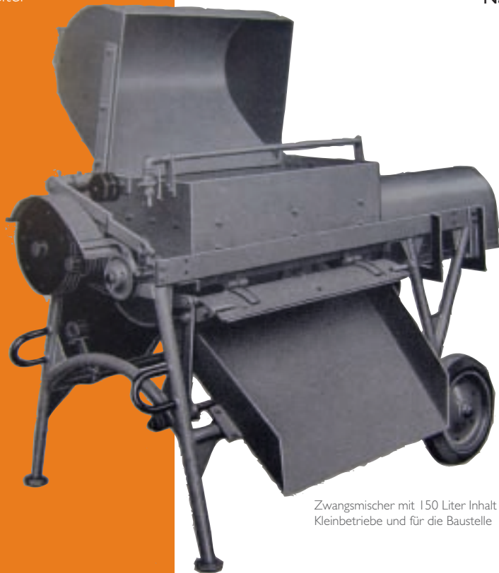
Zwangsmischer mit 150 Liter Inhalt für Kleinbetriebe und für die Baustelle

1967 Gründung der Landesfachgruppe Betonfertigteile und Betonwerkstein im Fachverband Bau in Stuttgart. Martin Ihle wird Landesfachgruppenleiter +++